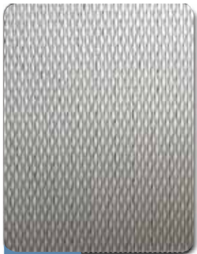
2WL® 1219.2mm (48")

El metal texturizado Rigid-Tex® minimiza el área de contacto con la superficie al comparársele con metales llanos. Este proceso reduce grandemente la fricción, la estática y ayuda a terminar con el atascamiento de las máquinas y el tiempo de inactividad. La materia prima o ya empacada se mueve más rápida y fácilmente por las fajas transportadoras, la maquinaria de embalaje, el equipo para procesamiento de alimentos y toda otra etapa de manejo de materiales. Están disponibles en acero inoxidable y otros metales con una selección de patrones y acabados del metal en relieve para cumplir sus necesidades.