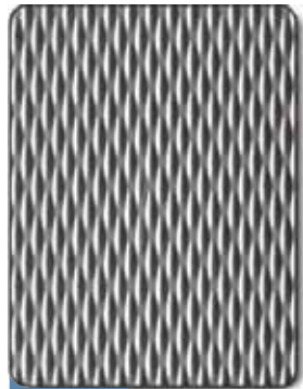
5WL® 1524mm (60")