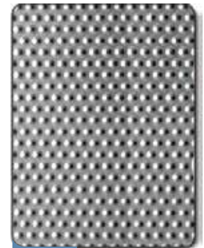
7DL 1219.2mm (48")